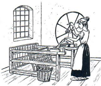
„Spinning Jenny“, Spinnmaschine mit 16 Fäden mit Handbetrieb (um 1775)